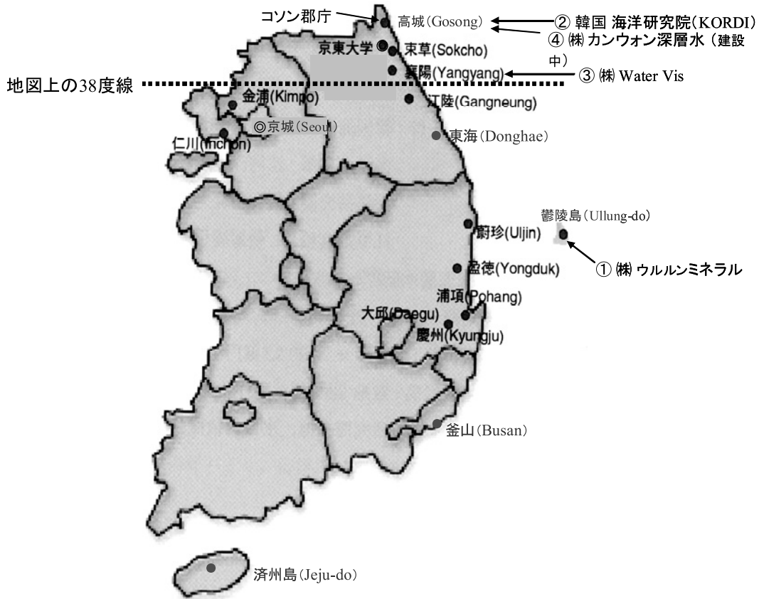
図1 韓国の海洋深層水取水施設