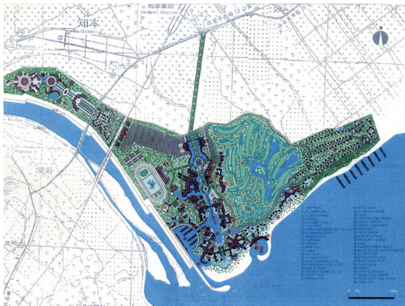
図2 JTLリゾートの全体計画図