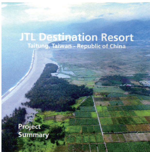
図3 空から眺めたJTLリゾートの建設予定地

められました。中でも七星潭海域の取り組みが最も早く、2005-2006年に3ヶ所に取水管の設置が完了しました(表1)。