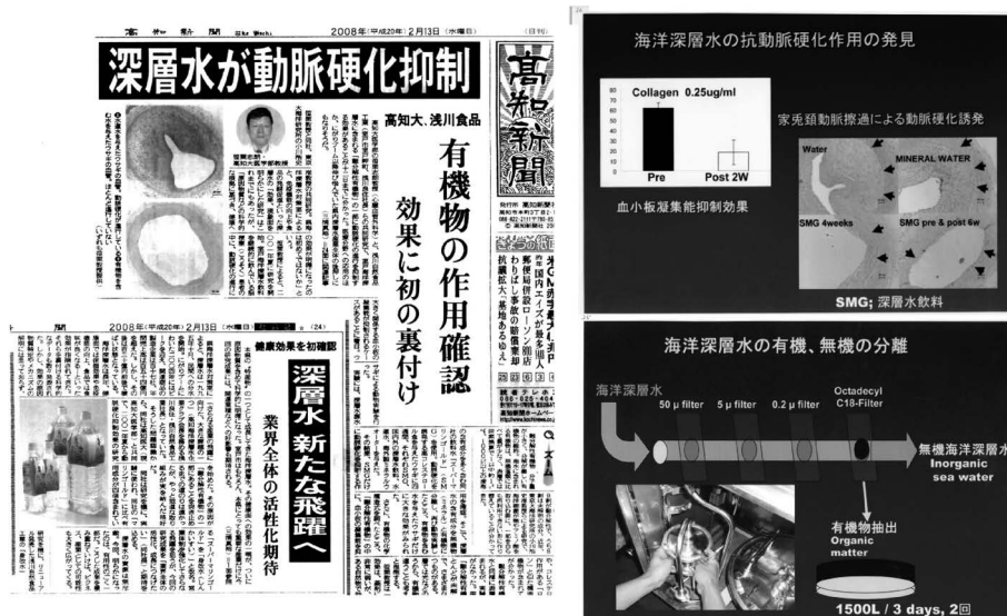
図1. 高知大学医学部との共同研究